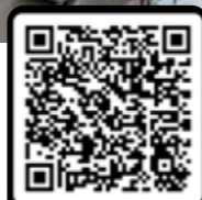
Brochure de référence

Une qualité éprouvée depuis 1973. De l'idée à la réalisation, de l'installation à la maintenance